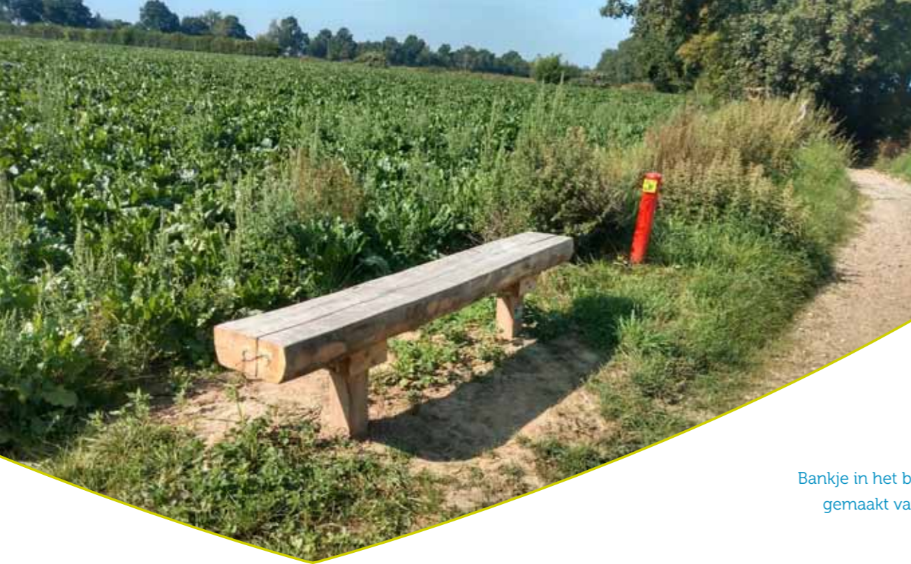
Bankje in het buitengebied gemaakt van stamhout.