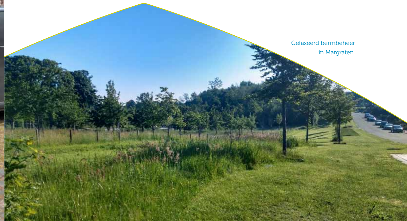
Gefaseerd bermbeheer in Margraten.

Variatie in beplanting en uitbreiding van het areaal heeft een positief effect op het leefgebied van wilde dieren. Vele zoogdieren, amfibieën, reptielen, vogels en insecten profiteren van gezond en gevarieerd groen. Dit neemt alleen maar toe als we geen gebruik maken van chemische bestrijdingsmiddelen. In Eijsden-Margraten komen zeer zeldzame soorten voor die uniek zijn voor Nederland. Bijvoorbeeld de geelbuikvuurpad, eikelmuis of vliegend hert. Soms kan het openbaar groen een bijdrage leveren aan het behoud van deze soorten. Door verschillende leefgebieden (vaak natuurgebieden) met elkaar te verbinden, kunnen dieren zich beter verplaatsen. Vanzelfsprekend kunnen ecologisch beheerde bermen daar een rol in spelen. Dit helpt de biodiversiteit te stabiliseren. Een goede inrichting heeft weinig waarde voor de biodiversiteit als we die verkeerd beheren. Daarom leiden we de buitendienstmedewerkers op om zich van de ecologische waarden bewust te worden en daar ook goed mee om te gaan.