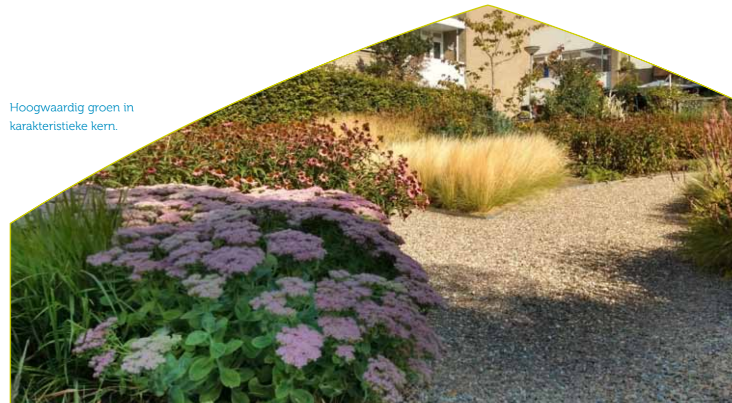
Hoogwaardig groen in karakteristieke kern.

We zijn trots op ons cultureel erfgoed; zowel op het materieel als op het immaterieel erfgoed. Groen met een bijzondere historische waarde kan dan ook op onze steun rekenen. Voorbeeld hiervan is de Platanenlaan aan de Graaf de Gelooslaan in Eijsden. Deze is gedeeltelijk in gemeentelijk en deels in particulier eigendom. De historische waarde is groot, maar de verkeersveiligheid is in het geding door zieke platanen in deze laan. Behoud is mogelijk maar vergt intensief beheer. We hebben dan ook het onderhoud naar ons toetrokken zodat bewoners en toeristen nog lang kunnen genieten van deze historische laan.