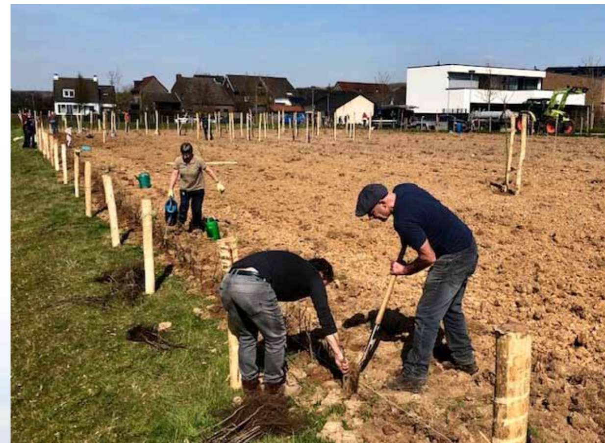
Bewoners van Bemelen aan de slag in de Dorpsboomgaard.

Onze inwoners zijn de dagelijkse gebruikers van de openbare ruimte. Zij weten dus ook als geen ander wat er goed is of beter kan. Uit onderzoek blijkt dat ongeveer de helft van de bewoners bereid is bij te dragen aan het onderhoud. Daarom ondersteunen we burgerparticipatie. Zo kunnen inwoners bijvoorbeeld zelf bijdragen aan een hogere kwaliteit van de buitenruimte of meer de nadruk leggen op ecologische ontwikkelingen. Als gemeente zijn we natuurlijk verantwoordelijk voor het basisbeheer. Maar inwoners kunnen extra kwaliteit toevoegen door eigen initiatieven.