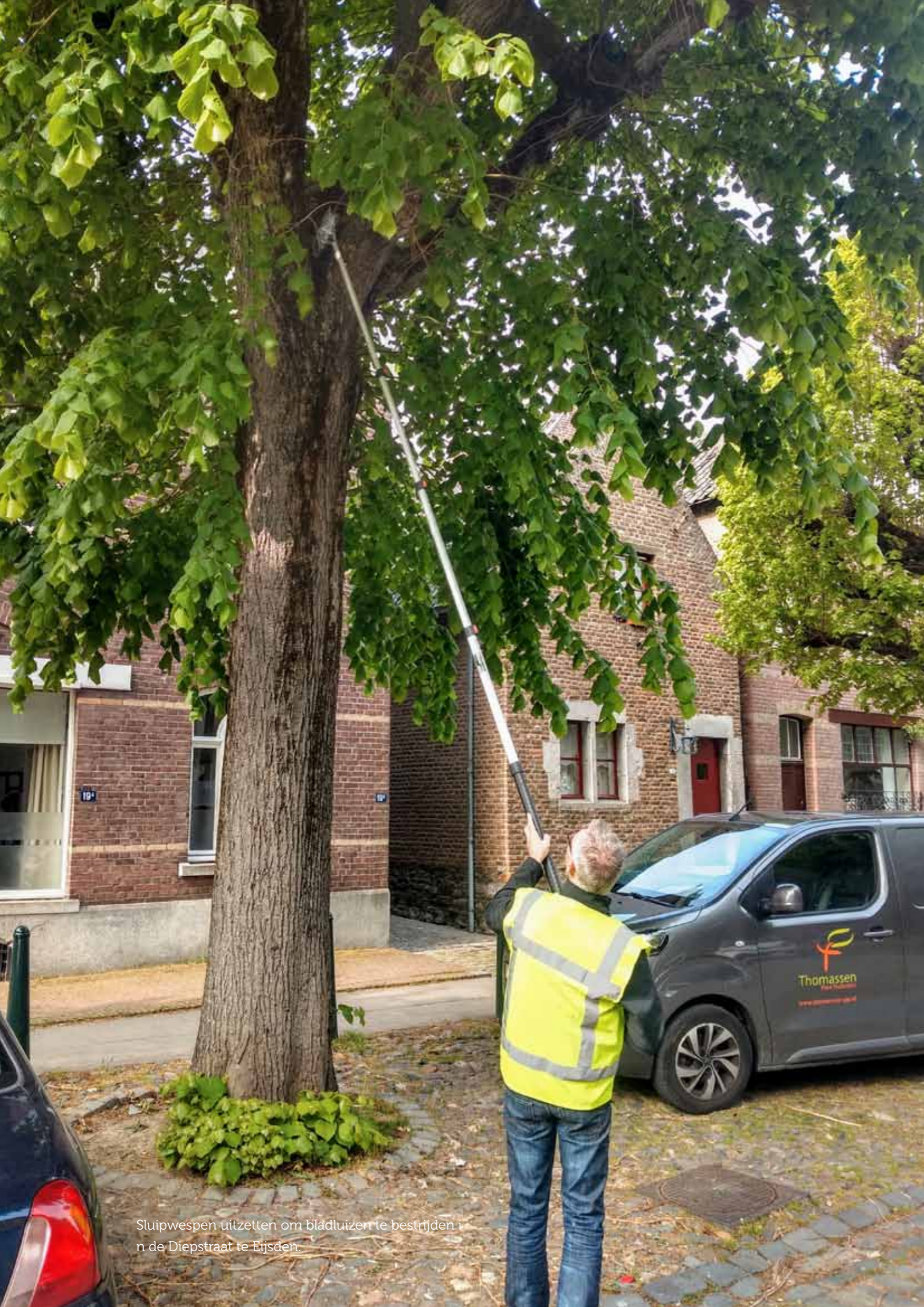
Sluipwespen uitzetten om bladluizen te bestrijden in de Diepstraat te Eijsden.