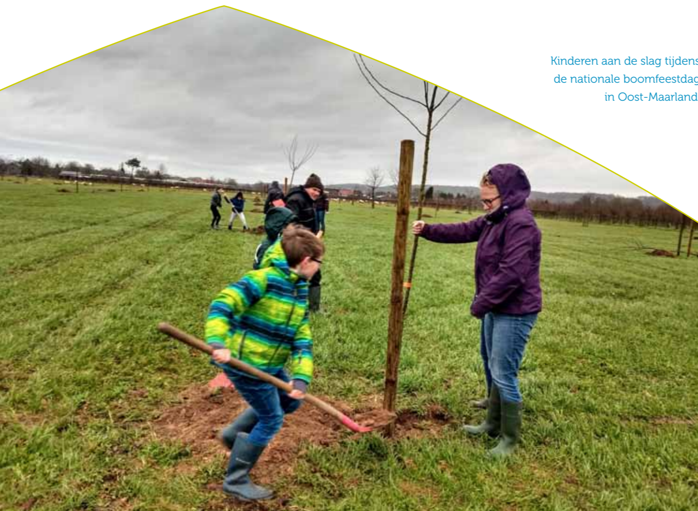
Kinderen aan de slag tijdens de nationale boomfeestdag in Oost-Maarland.

We willen het aantal bomen in de gemeente aanzienlijk laten stijgen. In de komen jaren planten we zo'n 8301 bomen aan op zowel gemeentelijke grond als op particulier eigendom. Het adopteren van bomen door de bewoners is ook een mogelijkheid. Om de bomen op de gewenste plekken aan te planten is een groenstructuurplan gewenst.