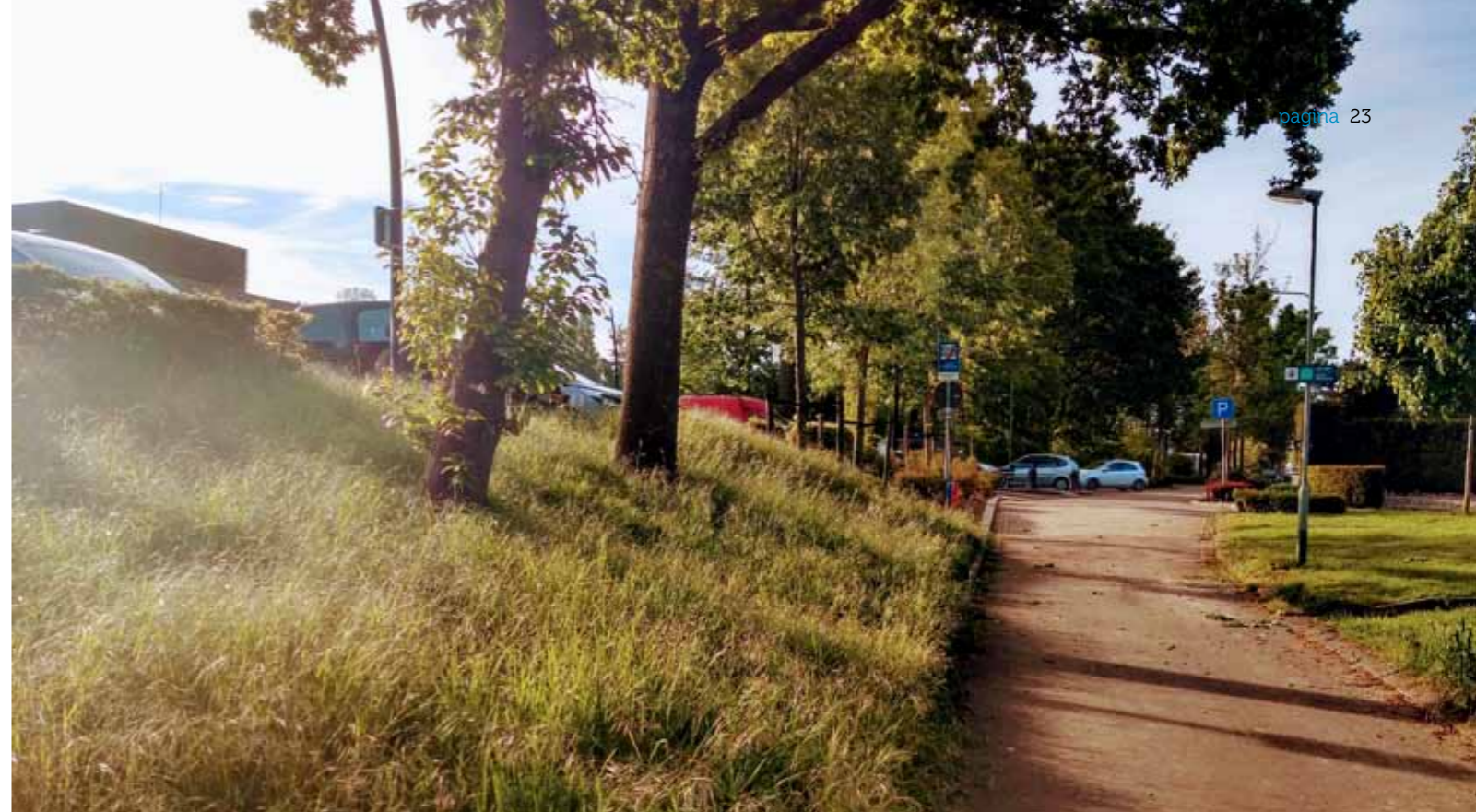
Structuurrijke berm nabij MFA De Hoven.